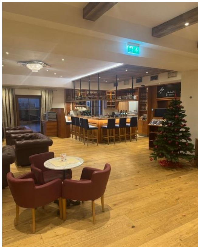
Podium Bereich bzw. Barbereich