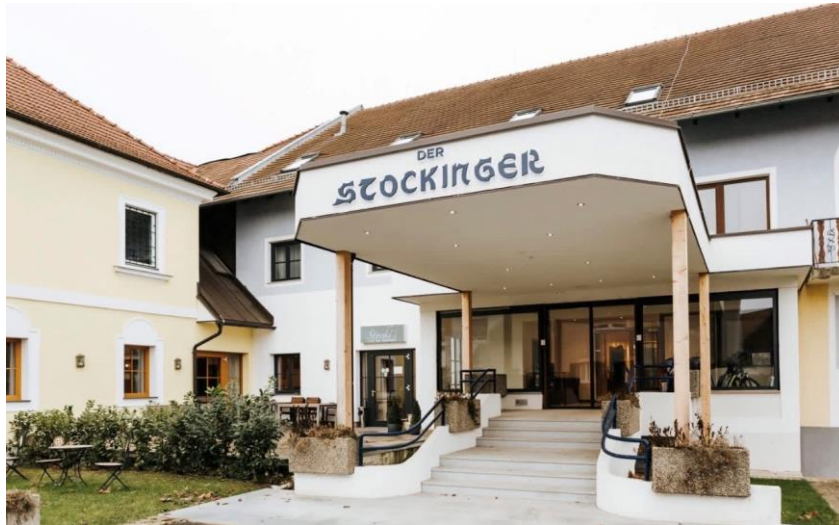
Hotel der Stockinger